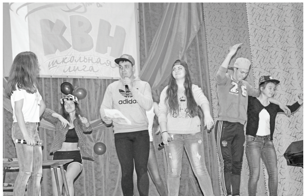
«Ребята с нашего двора».